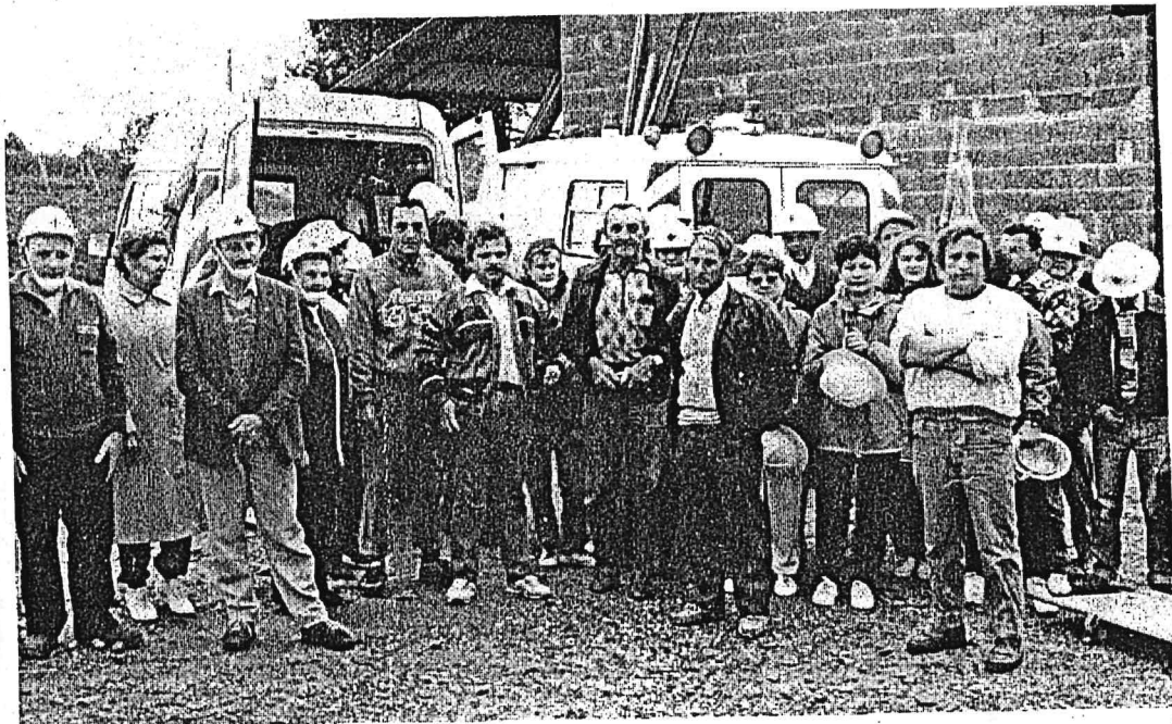
Les secouristes réunis pour un sauvetage périlleux.

Les centres de La Clayette, Paray-le-Monial et Marcigny en intervention à Saint-Didier