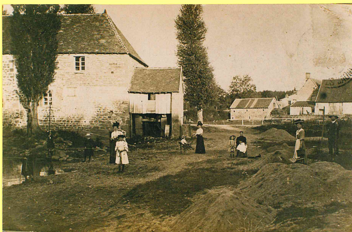
MOULIN AVEC LE PETIT HANGAR SERVANT D'HUILERIE