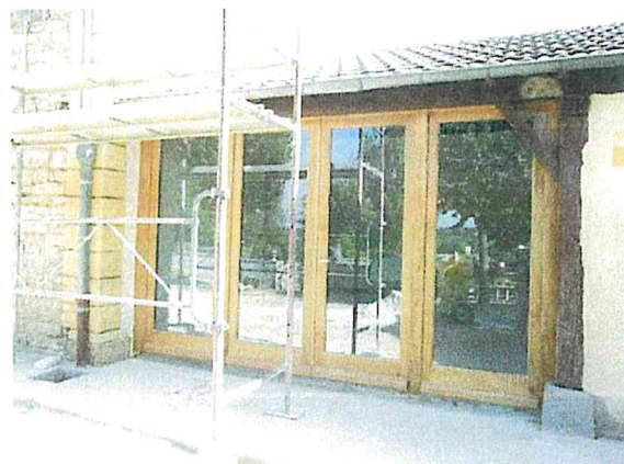
Photos prises pendant les travaux

La toiture de la salle polyvalente a été entièrement refaite par l'entreprise MACHADO suite aux dégâts provoqués par la grêle en août 2012 - Ces frais ont été entièrement couverts par l'assurance.